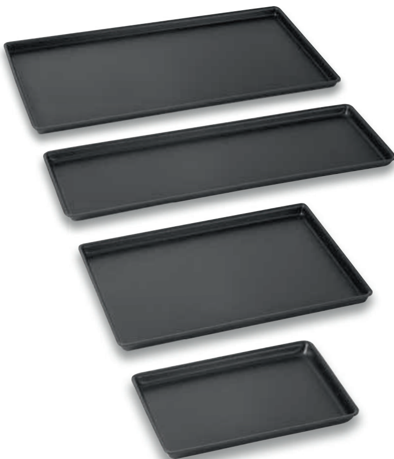
Auslageplatte schwarz strukturiert